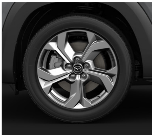
18-tollised heledad "Bright" viimistlusega valuveljed