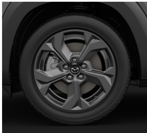
18-tollised "Grey Metallic" viimistlusega valuveljed 215/55R18