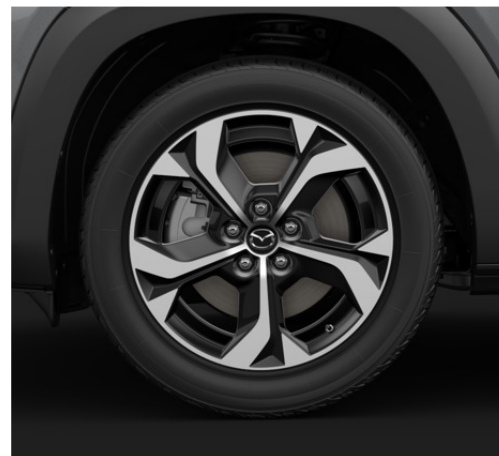
18-tollised "Black Diamond Cut" viimistlusega valuveljed 215/55R18