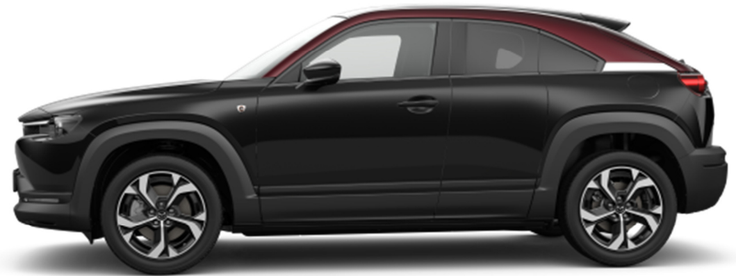
18-tollised "Black Diamond Cut" viimistlusega valveljed (215/55R18)