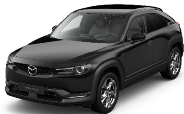
41W Jet Black