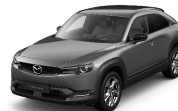
46G Machine Gray

Варианты цвета Premium Metallic по дополнительному заказу (цена — 850 евро)