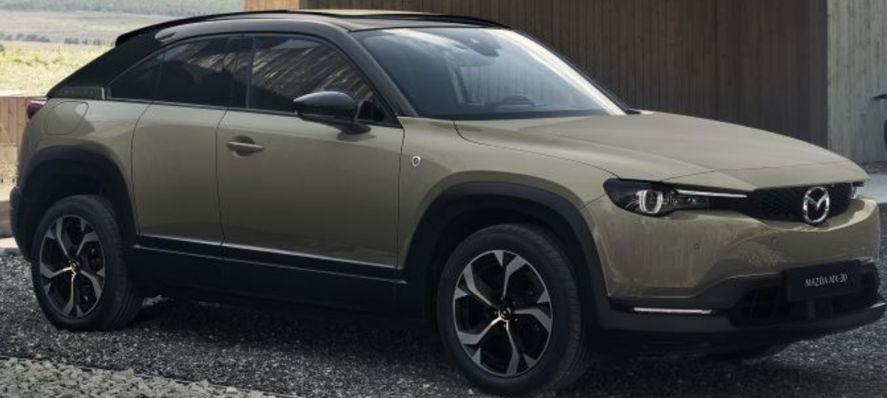
MAZDA MX-30 R-EV MAKOTO, ZIRCON SAND