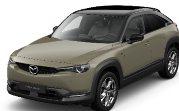
49T Zircon Sand