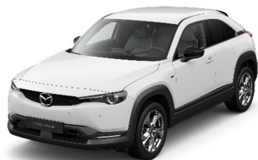
A4D Arctic White