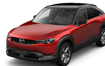
49V Soul Red Crystal