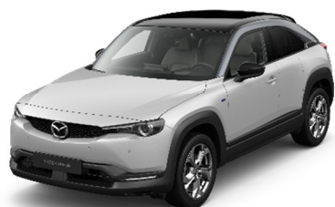
48A Ceramic White

Многоцветные цветные краски, только для марки Makoto 1500€