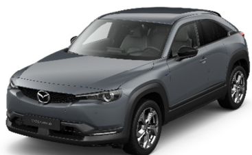
47C Polymetal Gray

Варианты цвета Metallic по дополнительному заказу (цена — 650 евро)