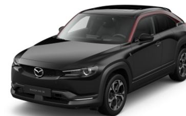
49F Jet Black – Maroon Rouge (бесплатно)

Варианты цвета Metallic по дополнительному заказу (цена — 650 евро)