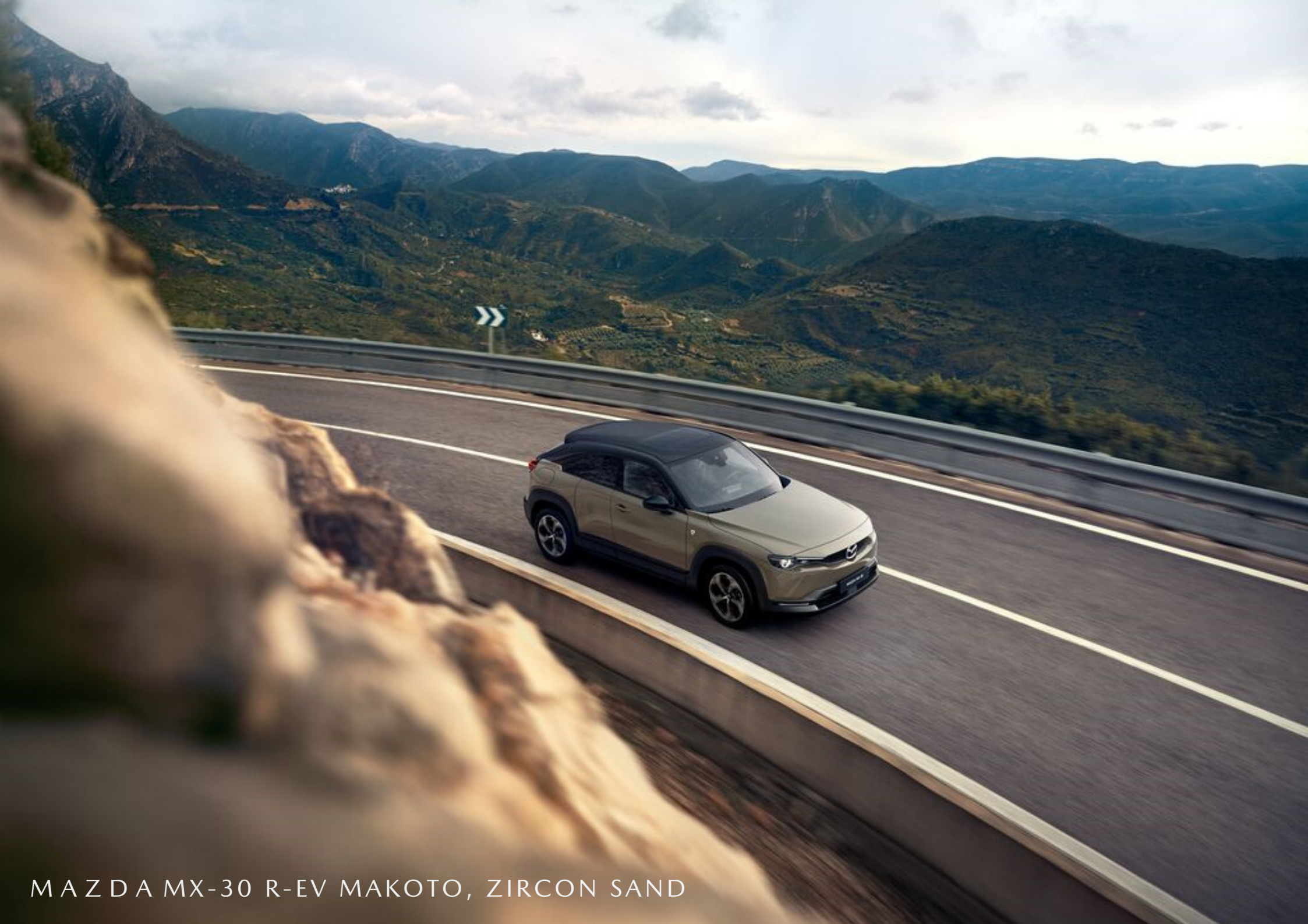
MAZDA MX-30 R-EV MAKOTO, ZIRCON SAND