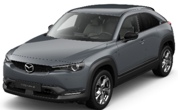
47C Polymetal Gray

Варианты цвета Metallic по дополнительному заказу (цена — 650 евро)