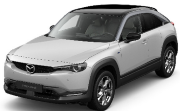
48A Ceramic White

Многоцветные цветные краски, только для марки Makoto 1500€