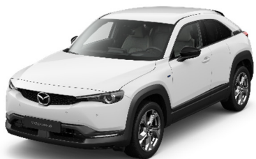
A4D Arctic White