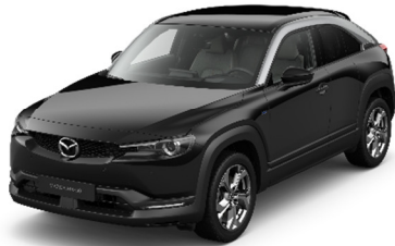
49P Jet Black - Silver